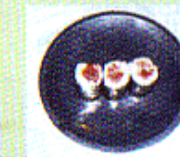
Tekka - Maki mit Thunfisch