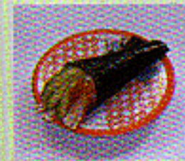
Temaki handgerollte Sushi-Tüten