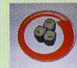
Avocado - Maki mit Avocado