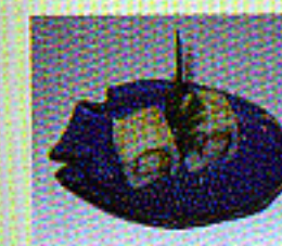
Californien-Maki mit Surimi Avocado