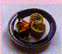
Gefüllte Rolle mit verschiedenen Gemüsen