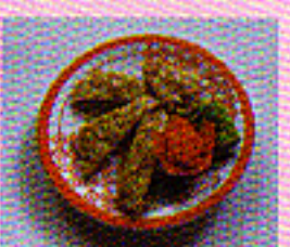
Hühnerfleisch mit Mandeln paniert