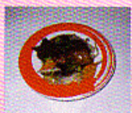
Saketeriyaki Lachs in Teriyakisoße