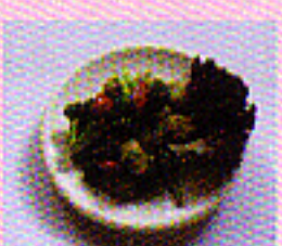
Fisch mit Broccoli