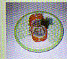
Futo Maki große Rolle