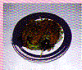
Kamo Teriyaki gebratene Entenbrust in Teriyakisoße