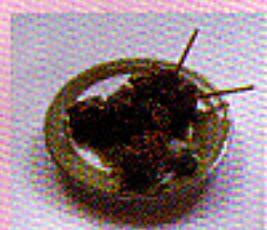
Yakitori Hühnerfleisch- Spieß