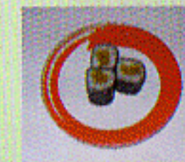
Oshinko - Maki mit eingelegten Rettich