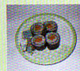
Sake - Maki mit Lachs