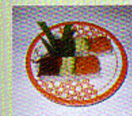
Tazuuna gestreifte Sushi in Scheiben