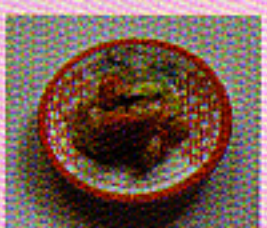
Zucchini mit Scrimps