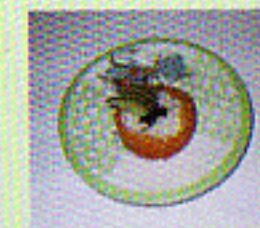
Ura - Sushi umgerollt mit Lachs