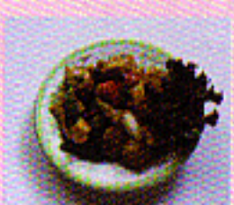
Schweinefleisch in scharfer Soße