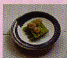
Sellerigemüse mit Scrimps