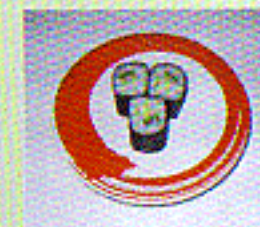
Kappa - Maki mit Gurken