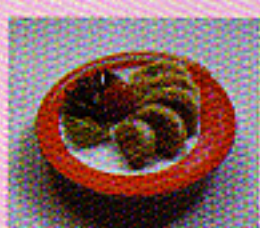
Tintenfisch mit Pastetenfüllung