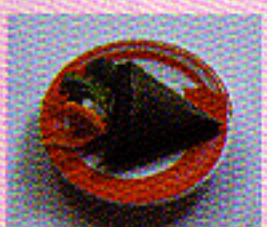
Bambusblätter mit Klebreisfüllung