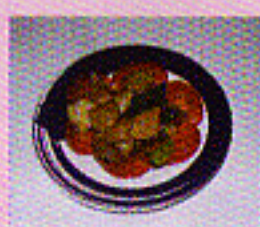
Hühnerfleisch mit Gemüse