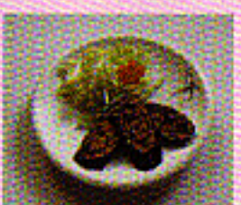
Seetang mit Gemüsefüllung