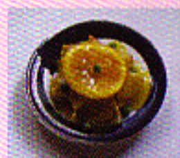
Hühnerfleisch mit Zitronensoße