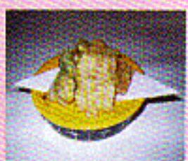
Tempura fritierte Gemüse